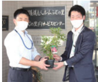
▲関西みらい銀行 緑と水の基金様より 平戸ツツジの苗木を 寄贈いただきました。