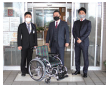
▲株式会社桑原組様より はね上げ式車椅子1台を 寄贈いただきました。