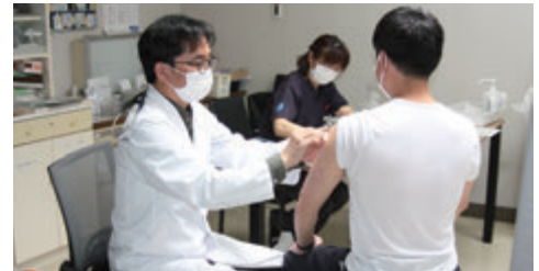
特養入居者、職員の新型コロナウイルス ワクチン接種は令和3年6月30日を以て希望 された方への接種(2回目)を終えることができました。