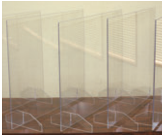
▲株式会社長宗様より 飛沫防止パネル5枚を 寄贈いただきました。