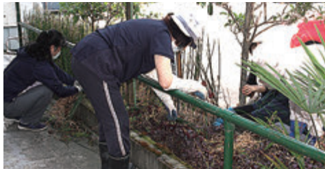
6月29日に地域のボランティア様が草刈り、 花の苗植えに来ていただきました。 暑い中、作業をしていただきありがとうございました。