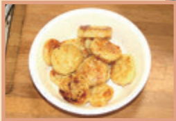
じゃがいもを おやきにして いただきました。